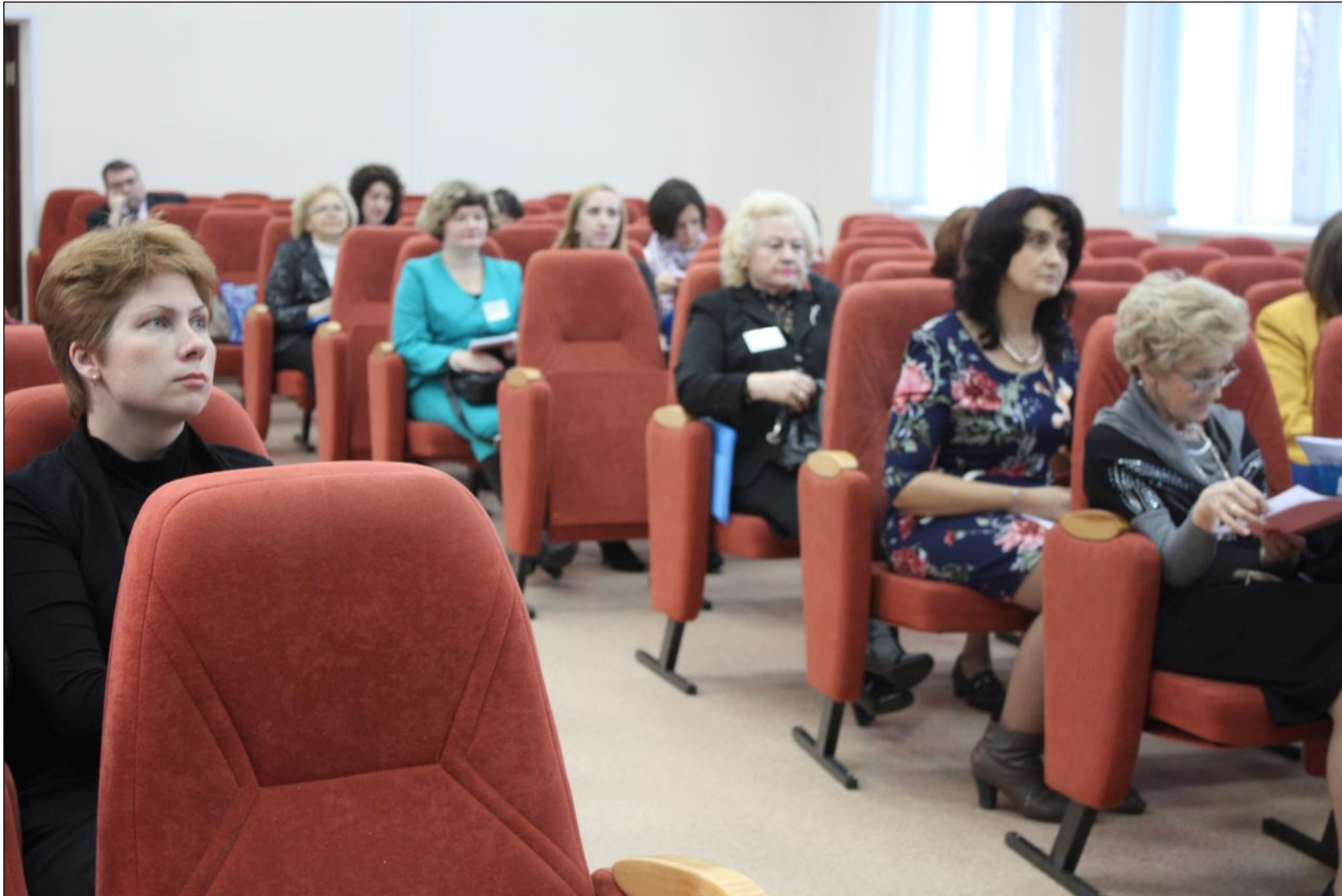
Пленарное заседание III Международной научно-практической конференции «Актуальные проблемы лингвистической подготовки в неязыковом вузе».