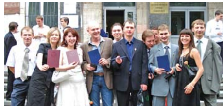
Горный институт (стр.2)