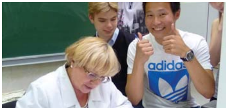
ИНМИН (стр. 3)