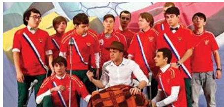
ДК МИСиС приглашает (стр. 4)