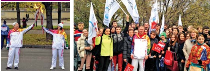
Министр образования и науки Дмитрий Ливанов 8 октября принял участие в эстафете Олимпийского огня, а потом сфотографировался со студентами родного вуза.