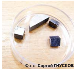
Композит на основе сплава алюминия с нанотрубками из нитрида бора, полученный методом горячего прессования.