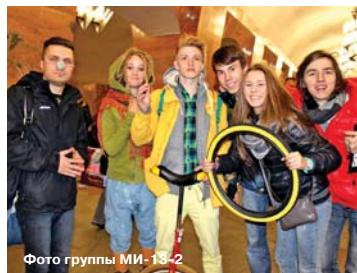
Фото группы МИ-13-2

Второй этап квеста – снова список заданий. Например: «Каждый день они смотрят на тебя с высоты, встречаешь венками и фанфарами, а ты их даже не замечаешь. Сколько их?» Или: «Запретный плод всегда