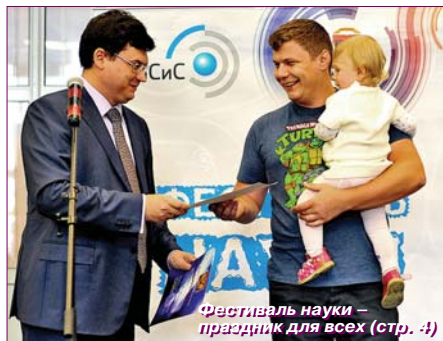
Фестиваль науки – праздник для всех (стр. 4)