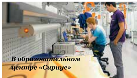
В образовательном центре «Сириус»