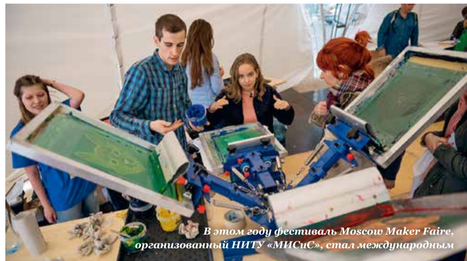
В этом году фестиваль Moscow Maker Faire, организованный НИТУ «МИСиС», стал международным

■ Стартовала программа подготовки кадрового управленческого резерва горнодобывающих компаний «Стратегический менеджмент на горнодобы-