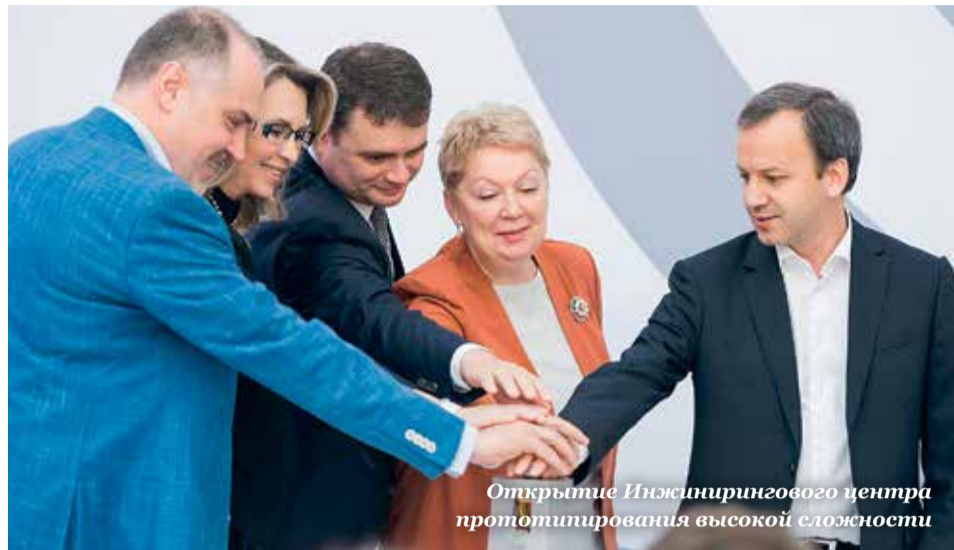
Открытие Инжинирингового центра прототипирования высокой сложности

подписано четыре соглашения о создании партнерских проектов с ведущими компаниями в самых разных сферах – Внешэкономбанком (цифровые технологии), РУСАЛом (новые материалы), группой компаний ИСТ (машиностроительные технологии и добыча полезных ископаемых), а также компанией MATADOR Industries (машиностроение).