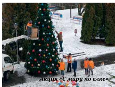
Акция «С миру по елке»

Несколько раз в году все желающие участвуют в благотворительной акции сдачи крови – как на станции переливания крови, так и в АО «ОМК» (компания-партнер совместно с нашим университетом много лет проводит выездные донорские акции). Кроме того, благотворительный фонд поддержки семьи,