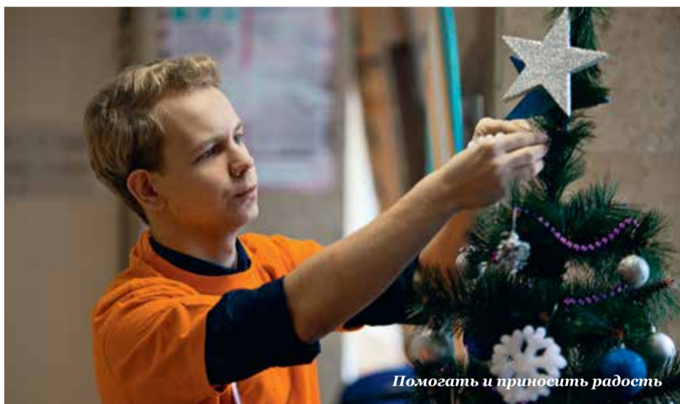
Помогать и приносить радость

Волонтерское движение нашего университета – одно из самых популярных среди студентов. Юношей и девушек с активной гражданской позицией, готовых бескорыстно прийти на помощь, становится так много, что сообщество волонтеров НИТУ «МИСиС» уже не вмещается в рамки одного движения – сразу несколько студенческих объединений развивают это направление как приоритетное.