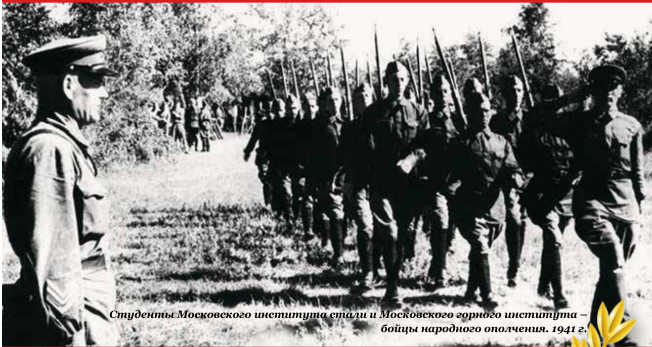
Студенты Московского института стали и Московского горного института – бойцы народного ополчения. 1941 г.