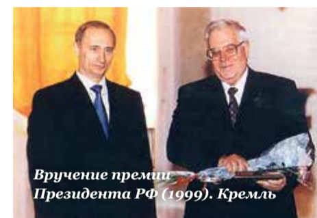
Вручение премии Президента РФ (1999). Кремль