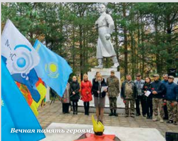
Вечная память героям!

В этих местах в 1941 году проходила оборонительная линия Осташков – Селижарово – Молодой Туд – Олено. А в 1942-м находился Ржевско-Сычевский плацдарм, где навеки осталось около 32 тысяч человек: в братских могилах, пропавших без вести, оставшихся на полях сражений, в траншеях, воронках и