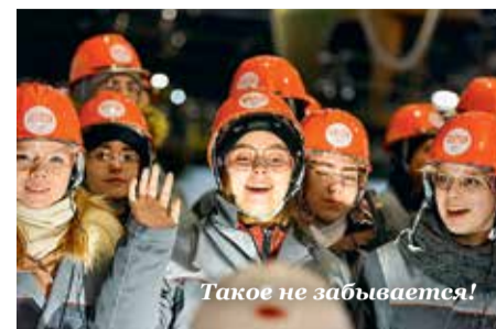
Такое не забывается!

Город Выкса Нижегородской области, в котором я родился и вырос, за последние годы сильно изменился, причем в