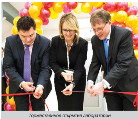
Торжественное открытие лаборатории