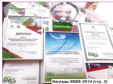
Награды ENES-2014 (стр. 2)

ГАЗЕТА УЧЕНОГО СОВЕТА И ОБЩЕСТВЕННЫХ ОРГАНИЗАЦИЙ МИСиС