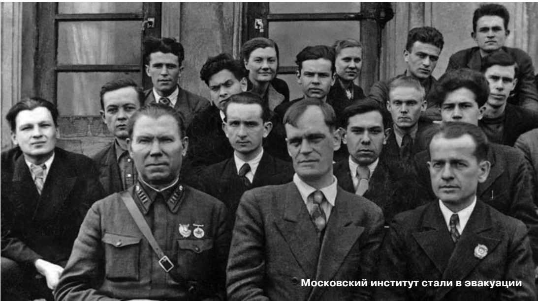
Московский институт стали в эвакуации

люди. Им давали другие фамилии, паспорта, квартиры, комнаты в коммунальных квартирах, простую работу. Вспоминается еще один, по-моему, небезынтересный факт, характеризующий особенности военных условий в большом городе. В начале сентября я шел к сестре через Каменный мост на Моховую. Был солнечный день, и вдруг слышу сзади звук летящего самолета. Оглянулся и вижу: по направлению к Кремлю на относительно небольшой высоте летит немецкий самолет. Впервые я испытал чувство обиды, беспомощности и ненависти к нагло и спокойно летящему немецкому летчику, не понимающему, почему его не сбивают.