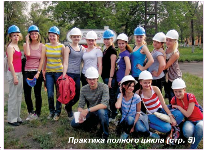
Практика полного цикла (стр. 5)