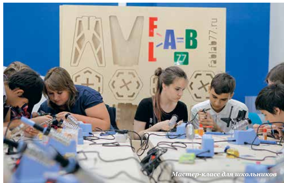
Мастер-класс для школьников