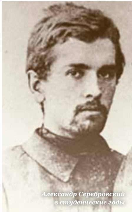
Александр Серебровский в студенческие годы

По инициативе А.П. Серебровского в Сибири были построены заводы – в Красноярске, Новосибирске, Иркутске, выпускавшие технику и оборудование для золотодобывающей отрасли. С 1929 года стал выходить журнал «Золото и платина». Александр Павлович Серебровский «всю душу вложил» в создание одной из самых эффективных отраслей в СССР – золотодобывающей промышленности. Результаты были потрясающими – в 1933–1934 гг. добыча золота буквально за год выросла вдвое. Поэтому Александр Павлович с гордостью докладывал на XVII съезде партии о том, что СССР вышел на второе место в мире