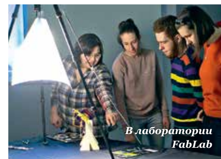
В лаборатории FabLab

В Lab, помимо работы с художниками, проводятся открытые лекции, экскур-