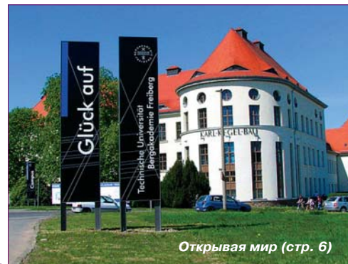
Открывая мир (стр. 6)