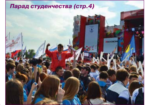
Парад студенчества (стр.4)

ГАЗЕТА УЧЕНОГО СОВЕТА И ОБЩЕСТВЕННЫХ ОРГАНИЗАЦИЙ МИСиС