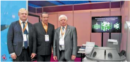
МИСиС на выставке (стр. 2)