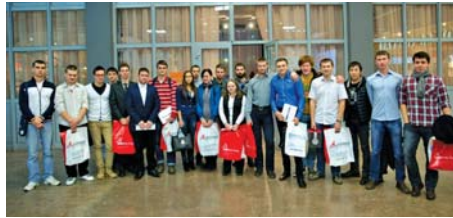
Авангард ренессанса (стр. 3)