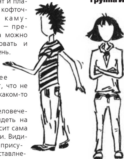
Рисунки на полосе Е. Нетужижкиной (ЭО-2-04)