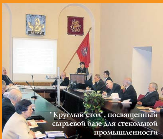
"Круглый стол", посвященный сырьевой базе для стекольной промышленности