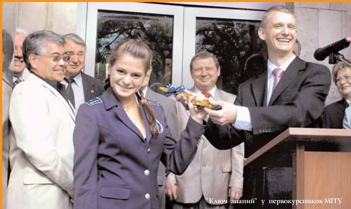
"Ключ знаний" у первокурсников МГУ

Первосентябрьский репортаж читайте на 2-й стр.