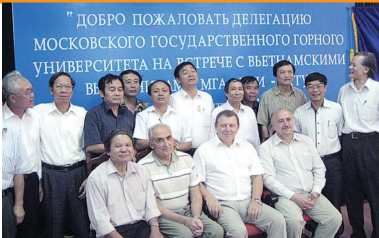
С 1959 года в МГИ-МГУ получили образование в области горного дела 316 представителей СРВ. Среди них 216 специалистов, 6 магистров, 60 аспирантов, 34 стажера. С "отличием" Московский Горный закончили 72 человека.

Мы подписали договор о намерениях по оказанию помощи в создании такой кафедры.