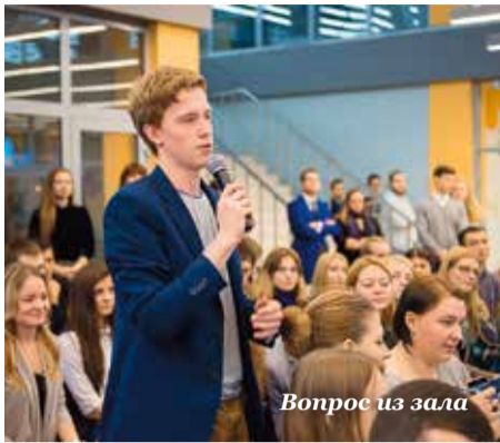
Вопрос из зала