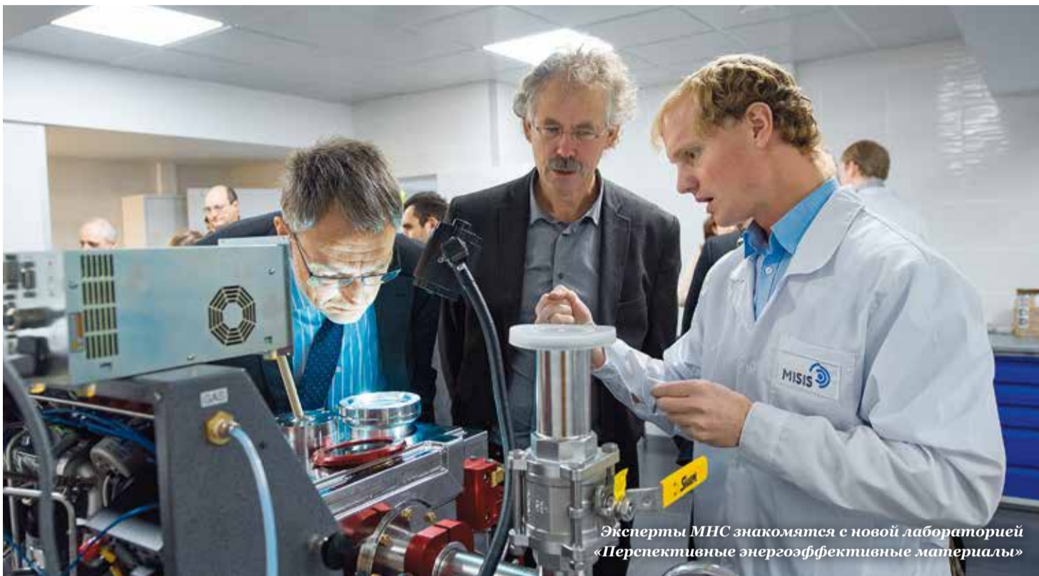
Эксперты МНС знакомятся с новой лабораторией «Перспективные энергоэффективные материалы»

ДЛЯ ТОГО ЧТОБЫ СТАТЬ УСПЕШНЫМ, УЧЕНОМУ В СВОЕЙ ДЕЯТЕЛЬНОСТИ СЛЕДУЕТ ЗАДАВАТЬ ВОПРОС «ПОЧЕМУ?», А ИНЖЕНЕРУ И БИЗНЕСМЕНУ – «КАК?».