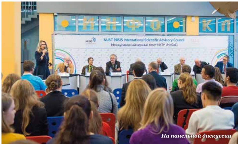
На панельной дискуссии