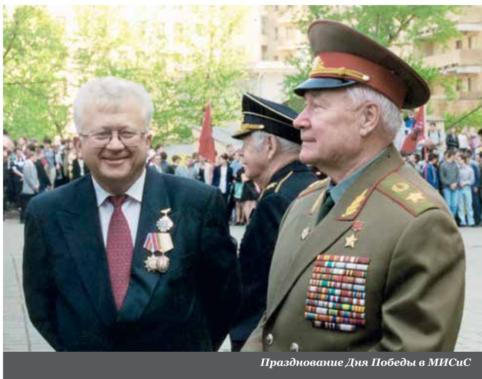
Празднование Дня Победы в МИСиС