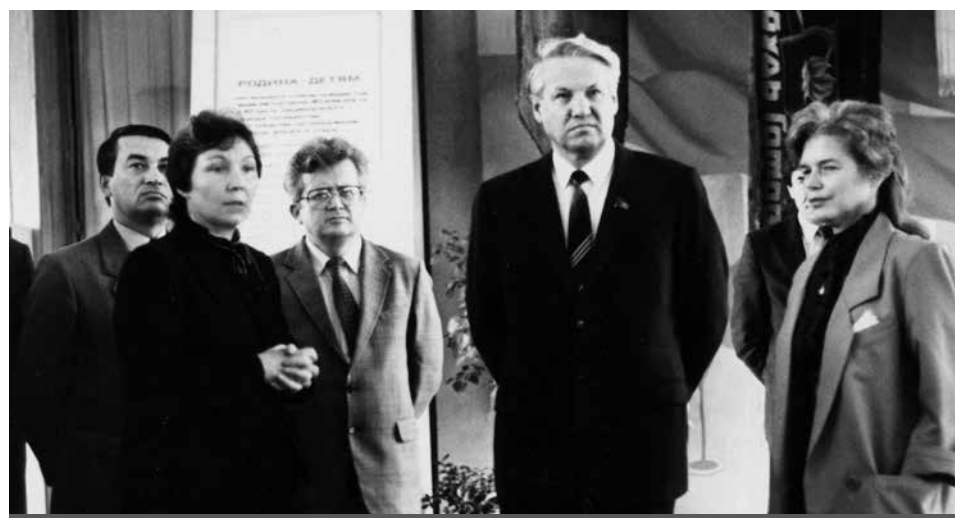
Ю.С. Карабасов и Б.Н. Ельцин