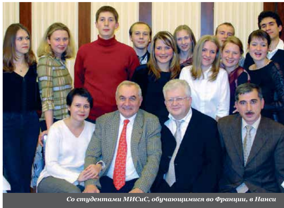
Со студентами МИСиС, обучающимися во Франции, в Нанси