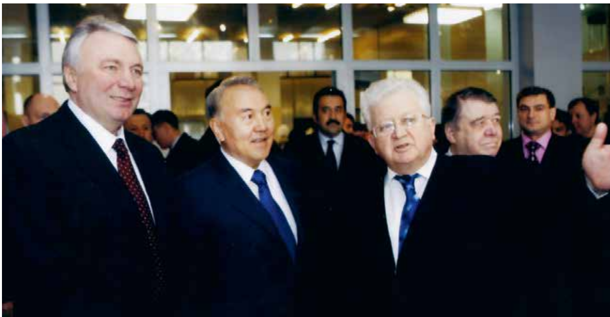
Ю.С. Карабасов рассказывает об университете президенту Республики Казахстан Н.А. Назарбаеву. Первый заместитель председателя Правительства РФ О.Н. Сосковец (первый слева).