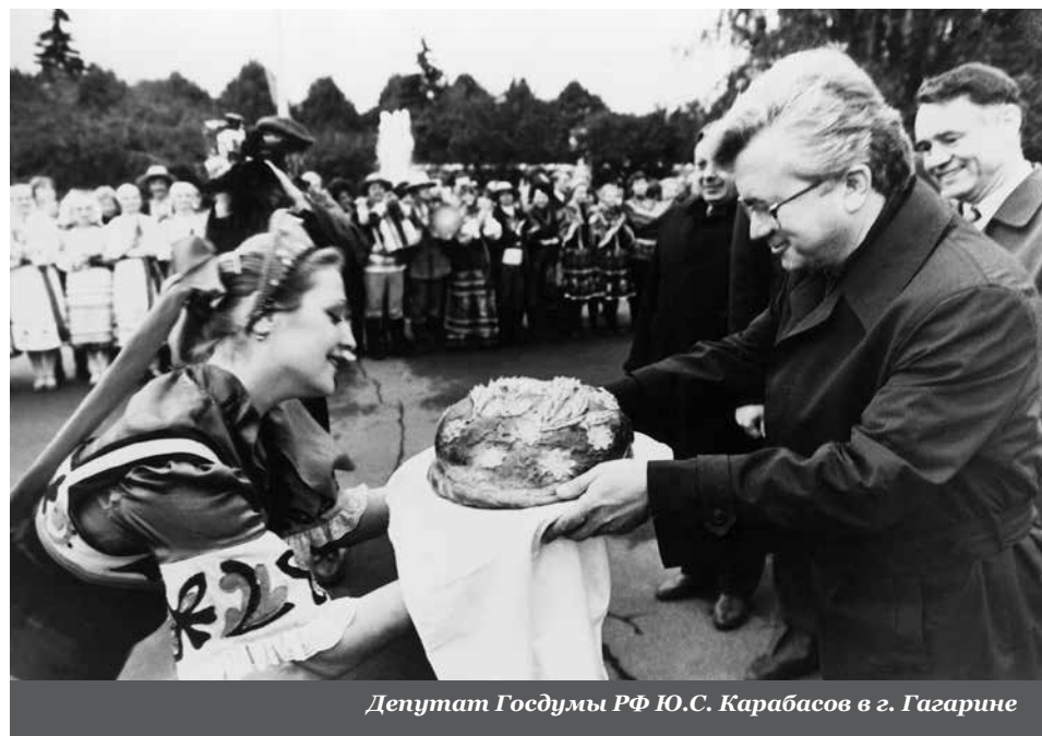
Депутат Госдумы РФ Ю.С. Карабасов в г. Гагарине