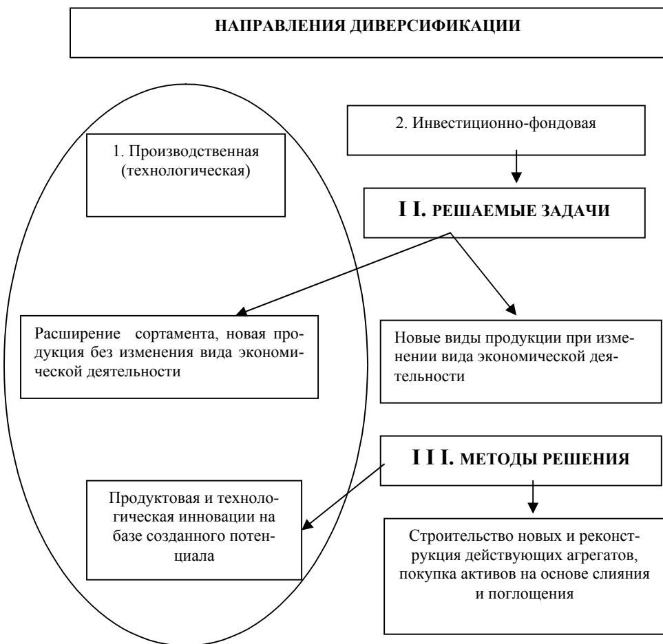
Рис. 2. Задачи и методы реализации основных направлений диверсификационной деятельности

На основе анализа сложившейся структуры металлопродукции и её возможных изменений в перспективе до 2020 года с учетом мировых тенденций, определены основные направления производственной и инвестиционно-фондовой диверсификации: