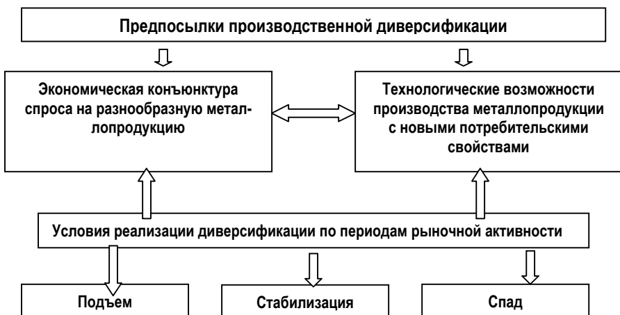
Рис. 1. Главные предпосылки и условия реализации производственной диверсификации

В диссертации обоснованы взаимосвязь и различия производственной диверсификацией, основанной на использовании технологических возможностей металлургического производства, и явившейся предметом исследования, и инвестиционно-фондовой (интеграционной) диверсификации (Рис. 2).